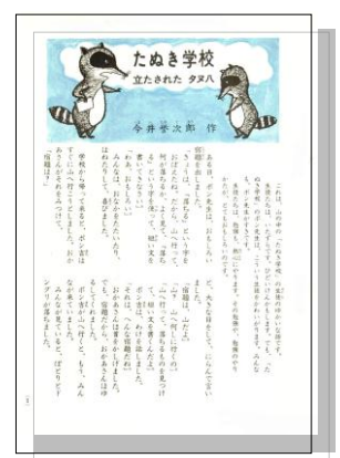
読解教材（内容は学年・月によって異なります）